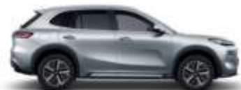
CLOUDVEIL SILVER (H33)