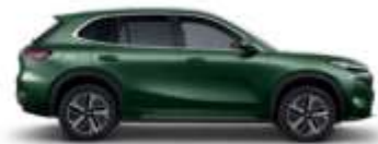
JUNGLE GREEN (H31)