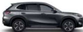
VOLCANIC GRAY (H29)