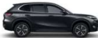
POLAR BLACK (H28)