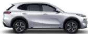
ALPINE WHITE (H32)