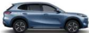
GLACIER BLUE (H30)